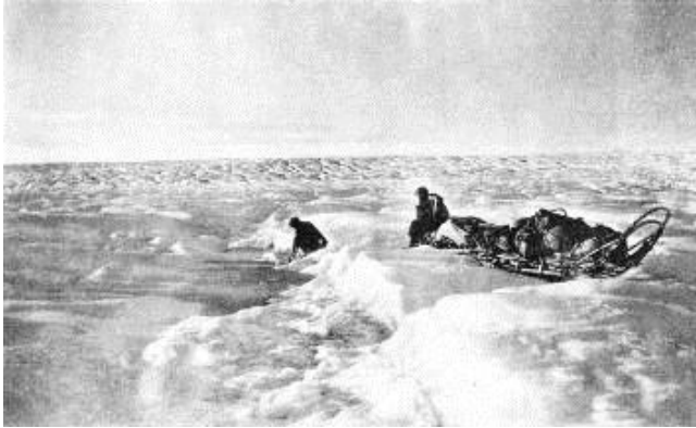
Sermimi seqineq kaaviinnartooq