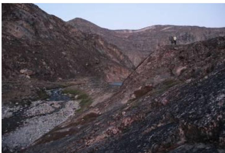
Sermillip kangerluata qinnguani Aanerit qaqaanni, Quervainip sermimut qaqqiffata eqqaani.

Nunakkut pisunneq taanna qaannamik angalereernerata ilungersunartup qaavatigut imminermini piunasaavoq annertoq – minnerunngitsumik ukiui eqqarsaatigalugit, kisianni marloriarluni silaqanngitsutornera sakkortusaasuusimagunarpoq. Naatsumik oqaatigalugu nammatakka annikigisassaangereeqisut, petruuliumik 40 pundimik ilapput – qaqqakkut qummukarnermi oqimaalleriaannartartunik, uangalu siuttuullunga aqutissarsioartariaqarlunga. Tassami Aanermit aqutissarput missingersuinnarparput. Stolbergip Baeblerillu nunap assingi nassarpaat. Uanga aqerluusamik titartagaq pujorsiuullu naammagisariaqarpakka. Tatsit qaqqallu qaavi paarlakaatiinavipput – sulilu sermimut anngunnata.