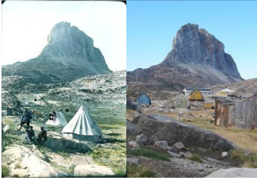
Baebler, de Quervain aamma Stolberg Ikerasammi