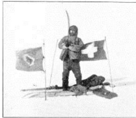
Alfred de Quervain ungasinnerpaamut Killiffiminni

(Assit: "Durch Grönlands Eiswüste", Strassburg 1911)