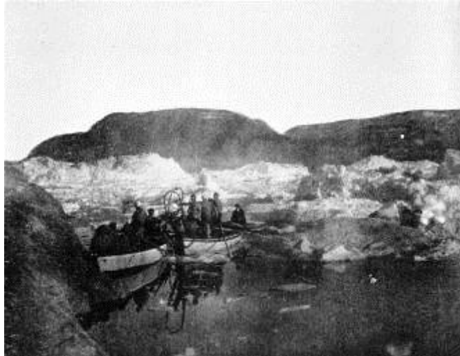
”Ajornaqaaq” – Qarassat Kangerluanni allatut ajornartumik utiinnartariaqarpugut (Assit: ”Durch Grönlands Eiswüste, Strassburg 1911)

Qajartortut sulillaarsimappata, angalasutut pisinnaatitaavugut silaqanngitsumininnguamik niuertorutsip tunniusnaanik ilagiisilaarsinnaallugit. Nalinginnaasumik imigassat suulluunniit kalaallinut matoqqalluinnaraluarput. Immikkut taamatut akilerneqalaarneq kalaallit taasarpaat ”snapsemik”, immikkut pisoqartillugu, imigassamullu akerliusunik malittarisassaqaqarualartoq tunniussinnaasarput, soorunami inuummarissaatitut pinnagu, suliali naammassinerani iluarinninnermik ersersitsinertut; soorlu erinarsuut oqaasertaqanngitsoq, kalaallinit paasilluarneqaqisoq. Maanna oqaasertalernissaa tullinguuppoq. Hannibalip Peobene-miinnerata (Italiap avannaani Schweizimut killeqarfiup eqqaani narsaamaneq naggorrisoq) akerlianik Qarassat Nunataanni qaqqat aanngasissut tikkuarpakka; taamaalineranilu Stolbergip dunki silaqanngitsumik imalik kulluminik tikiminillu tigullugu kivippaa, piniartullu kialuunniit uummammut attortissutigisassaanik neriorsuilluni taakunga apuukkutta najorsitineqarumaartut. Ussersuinnarluni kaammattuineq sulisutsinni sunniteqanngitsuumngilaq; kisianni sikualuppasuit angallaterput kaajallallugu assiaqutaasut siuntingsinnilu ilularisuit isigivaat, illariaallallutillu paasitilluta taamaluunniit angitigisumik silaqanngitsumik asasaminnik neriorsorneqaralarunik aqqutissarput ajornartoq.