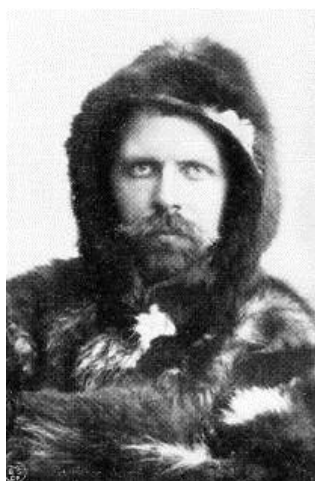
Alfred de Quervain