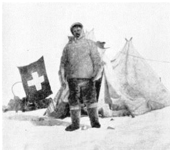
Baebler qimatulivitsinni issittorsiuteqarluni (Assit: "Durch grönlands Eiswüste", Strassburg 1911)

Aqaguani ullaakkut Baeblerilu qinngusersaaratta isumaqaleraluarpugut qernertuminermik siunitsinni sermimiit nuisasumik takulluta. Qaqqaaq, nunataq! Pikkutsattorujussuuvugut; kisiannili Stolbergimut oqarata, takusarpullu atserallarlugu "Schweizimiut Nunataannik", nipaatumillu nuannaarluta kangimut-kujammut ingerlaalerluta. Akunnerit marluk paarlakaattunik neriuteqartareerluta, paasivarput apusinnernerup tarrartaa takusimallugu, qaamarngup qinngornerisa akisugunnerat pissutigalugu portunerusutut isikkoqartoq. Pakatsinerput ilaatigut illuatungilerneqarpoq maanna sermip qaava quppaqanngingajattoq tikikkatsigu, silaqqissiulerlulalu, anoreqarani seqinnarik, atisagut masattut panersersinnaallugit, silami igalluta, kiisaluuna ilulliinnaalluta tuperput ammatiinnarlugu sinnissinnaasugut. Tikitarput atserparput "Mont Soleil" (Seqerngup Qaqqaa). Sermimi itersisimanerujussuit manissuinnaat, tasertaqanngitsut avaqqullugit – aammami ullukut imermik takussaasueruppoq – ingerlareerluta, paasivarput sulii Qarassap Sermiata timaaniilluta.