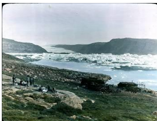
Qarassap Imaa. Nunaqarfik Qarassat Sermiannut isikkivilik

Unnuarsuarmut qimminik misilittakkagut oqaluttuareqattaarlugit immitsinnut aliikkusersorpugut, anersaarneq ajulerluta illartarluta. Oqaluttuarunnaameqqugaluarpakka itingarlugilli, naakka sapilermata ernumagingakku unnukkaa nerisakka meriaarissallugit – taava pisoqarpoq nerisatitsinnut mamartunut ajoqutaasumik. Ajoqutaanerpormi? Paviap napparsimasup qimmiisa saluttut asuliinnaq ungasianiit aalariarninnguagut tamaasa alapernaassimangilaat. Uisorertertut sukkatigalutik nerisassagut tamaqqinnaasa aallaruppat. Unnuap ingerlanerani kaallunga iterpunga, takungakkulu arnartavut qiulerlutik ivikkani masattuni imminnut attuutivillutik sininniarsarisut, tippera tunniuppara. Isumaqarpunga taama iliornerma eskimuut ilaginerisa sinnerani Nikodemusimik aqaatitaartikkaanga ("Nikodemus-ip unnuakkut ornippaa...), maannamummi eqqoqqissaanngikkaluartumik "utoqqarmik" taagorneqaraluarpunga, immaqamerlanertigut uanga isumaqatigiinniartuusarama. Baeblerip taaguutigaa Daniel. Tamanna toqunerarneqaraluarneranut attuumasorivara ("Daniel, sulii uumavit?"). Kalaallimmi Biibili ilisimalluinnarpaat. Stolbergip aterusia Biibilimut tunnganngilaq; qarlini sungaartut ersareqisut pissutigalugit taaneqartarpoq Kussak.