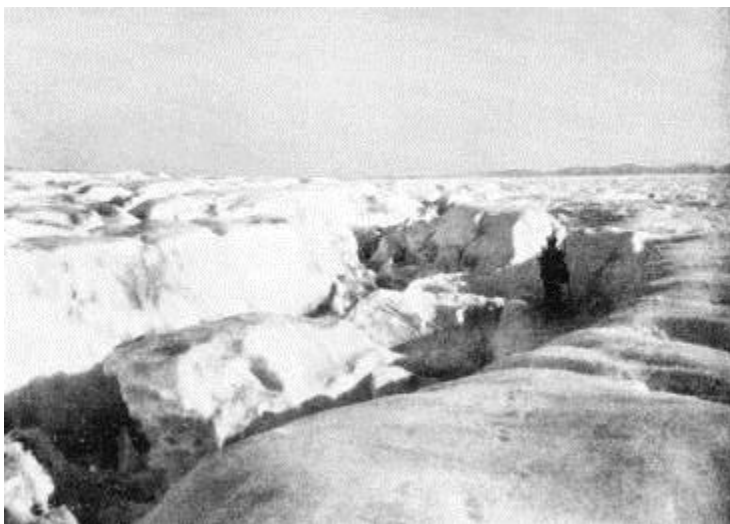
Quppaqarfimmi alapernaaserneq (Assit: ”Durch Grönlands Eiswüste”, Strassburg 1911)

”Nutaamik annertuumik alapernaarsuivugut, paasisaqarfigisatsinnik, sermip timaata pissusiinik paasisaqarfiginerungatsigu, isumannaatsumillu aqutigisinnaasatsinnik tikkuunneqarluta. Timaani qooqqrnerit siumut takorloorneq ajornartut annertuumik paasisaqarfigivagut. Tappavunga pinissara qilanaarivara.”