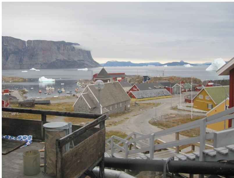
Erik Torm Août 2012