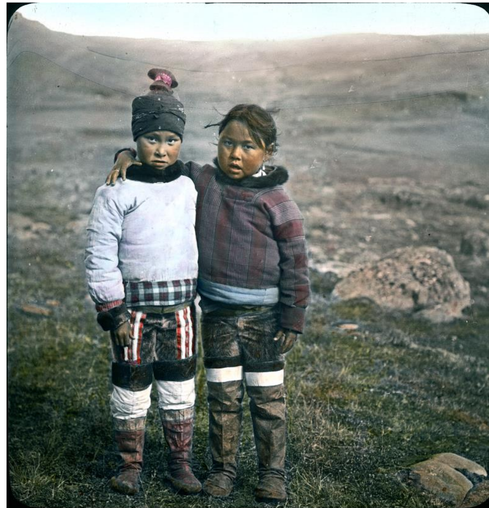
Arnold Heim, 1909, ETH Library, Image Archive