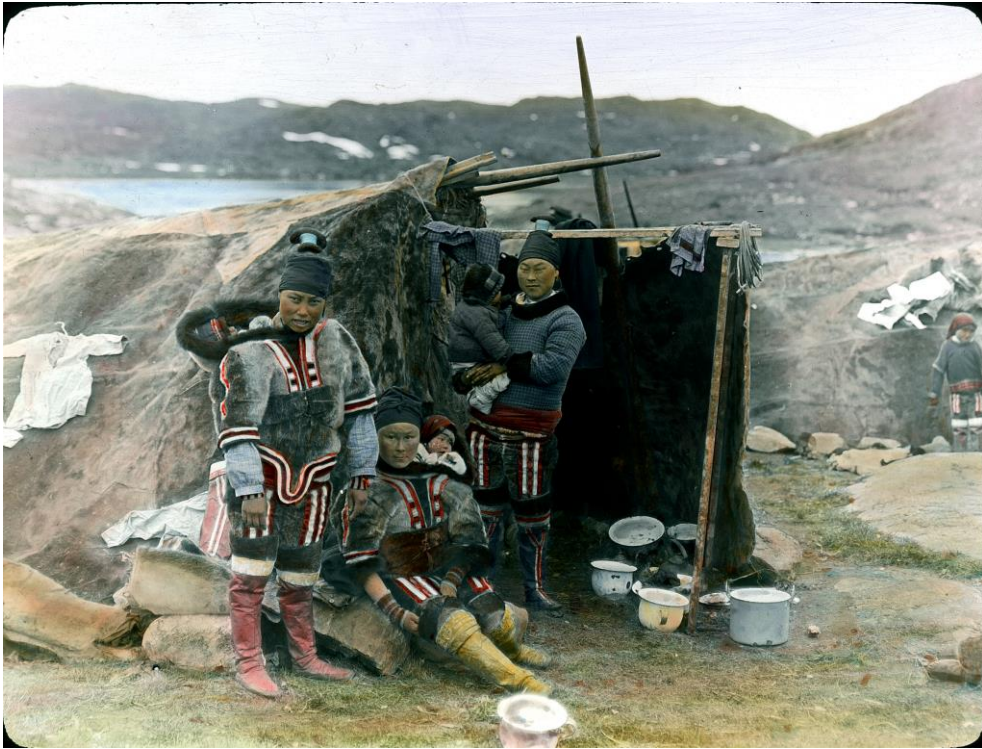
Arnold Heim, 1909, ETH Library, Image Archive