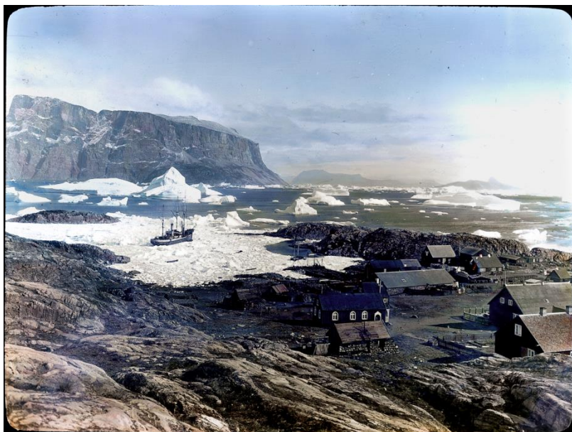
Arnold Heim August 1909, ETH Library, Image Archive